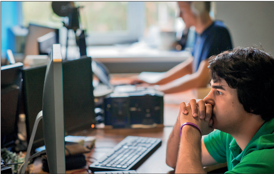
Постоянное присутствие вербовщиков ИГИЛ в соцсетях.

Активисты ИГИЛ поддерживают свои аккаунты в сетях Facebook, Twitter, Instagram, Friendica, Telegram. Активно они заявили о себе и в российских социальных сетях: «ВКонтакте» и «Одноклассниках».