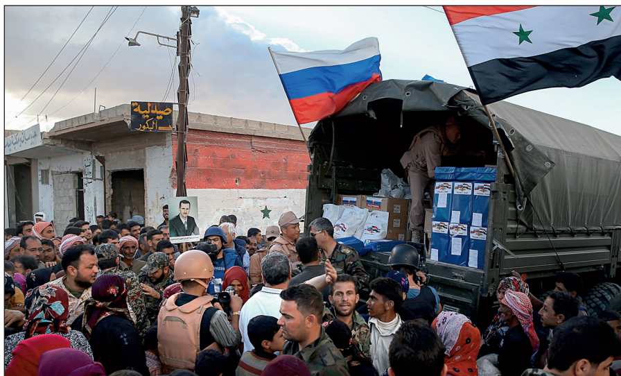
Россия оказывает гуманитарную помощь Сирии.