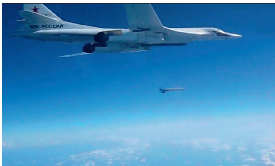
Воздушная операция российских ВКС по уничтожению боевиков ИГИЛ в Сирии.