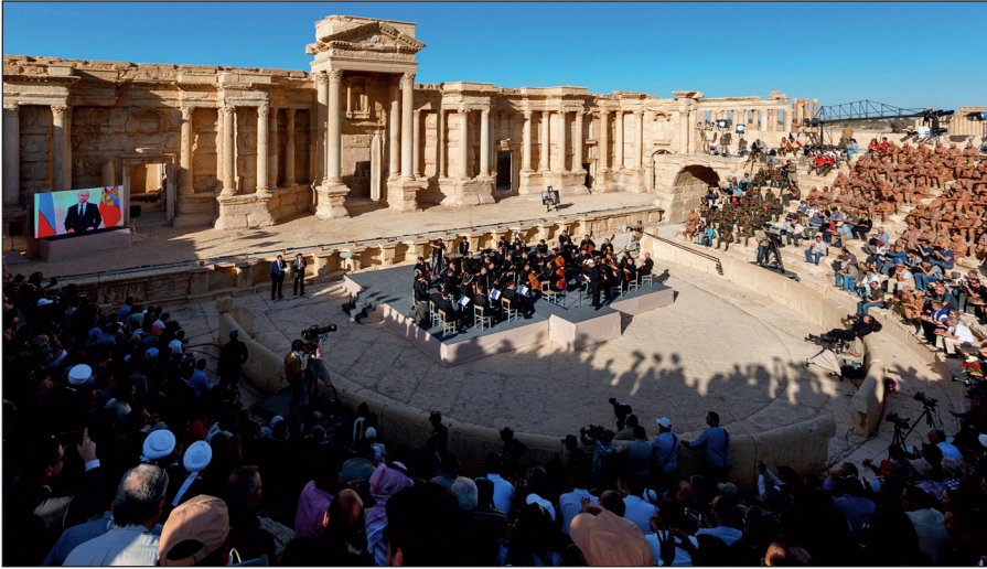
Освобожденная Пальмира. На концерте симфонического оркестра петербургского Мариинского театра под руководством народного артиста России Валерия Гергиева в Римском амфитеатре сирийской Пальмиры, освобожденной от террористов ИГИЛ.