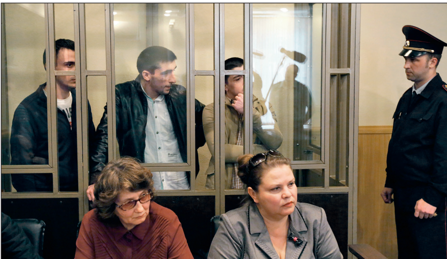
В Российской Федерации предусмотрена административная и уголовная ответственность за пропаганду идей терроризма, участие в деятельности террористических организаций.