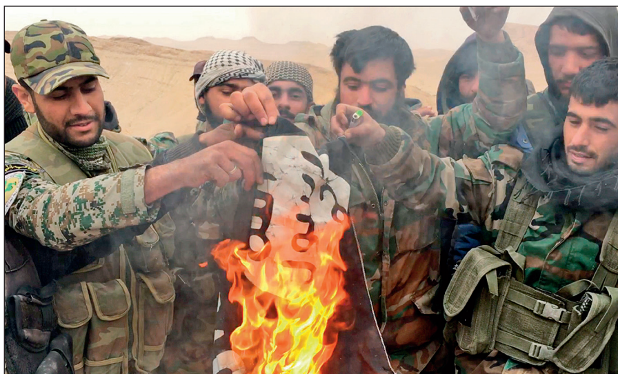
Народные ополченцы САР сжигают флаг ИГИЛ, снятый с отбитой у боевиков цитадели Пальмира.

Современное государство обязано защищать интересы каждого своего гражданина вне зависимости от его расы, национальности, принадлежности к определенной конфессии или религиозной традиции, в то время как ИГИЛ выражает интересы небольшой группы религиозных радикалов, жестоко подавляя остальную часть населения посредством запугивания, насилия и террора.