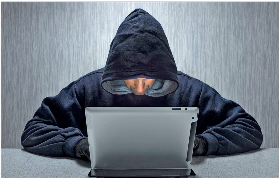
Вербовщики ИГИЛ активно используют Интернет.

Террористы день ото дня совершенствуют методы вербовки новых сторонников, а также алгоритмы их идеологической обработки. Читателю стоит помнить, что те типовые ситуации, которые описаны в данном пособии, можно рассматривать лишь в качестве базовых ориентиров,