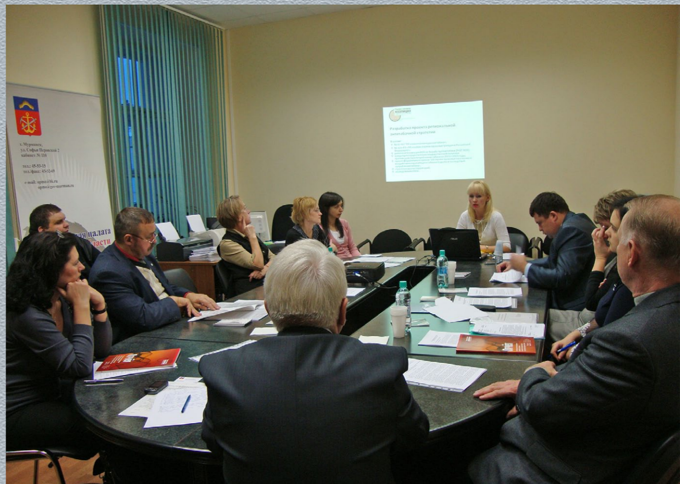
Заседание рабочей группы по противодействию распространения табака