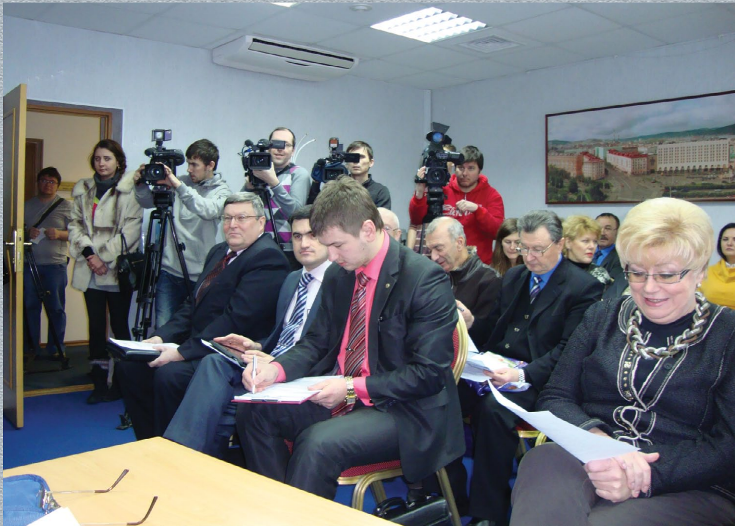
Межкомиссионное заседание 31 января 2012 г.