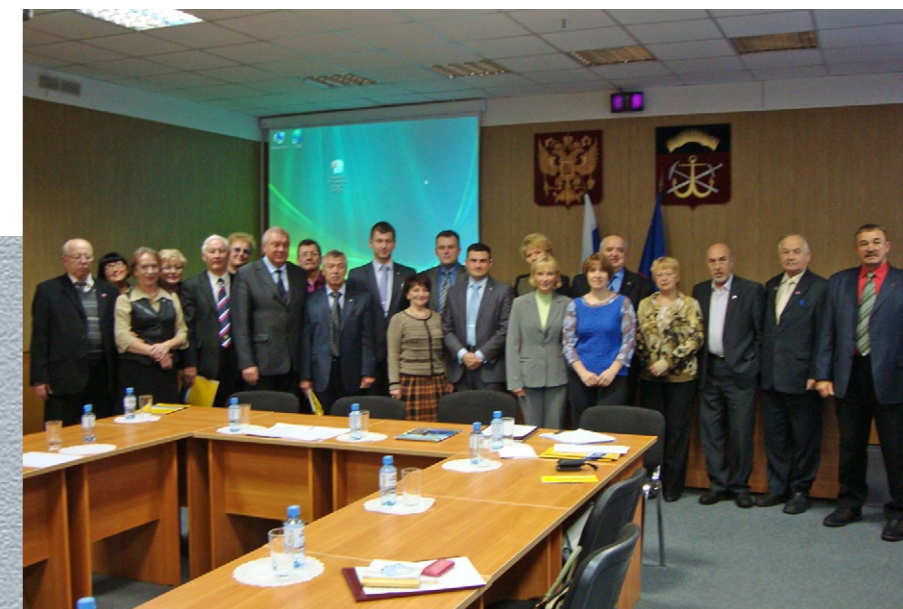
Вверху справа: после пленарного заседания 15 ноября 2012 г.