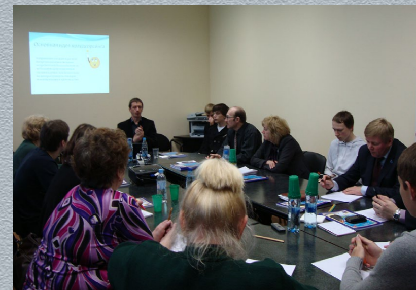
Семинар «Краудсорсинг для Общественных палат и НКО»